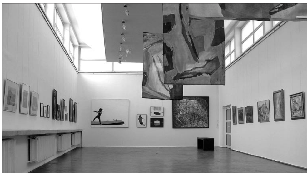
Galeria Pryzmat, ekspozycja „Nowi członkowie ZPAP”, wrzesień 2005