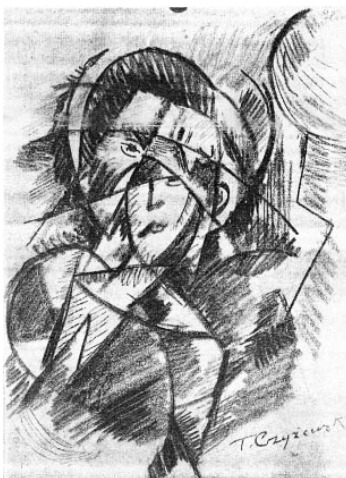
Tytus Czyżewski „Głowa” (rysunek), 1915

MIESIĘCZNIK ILUSTROWANY POŚWIĘCONY SZTUCE PLASTYCZNEJ