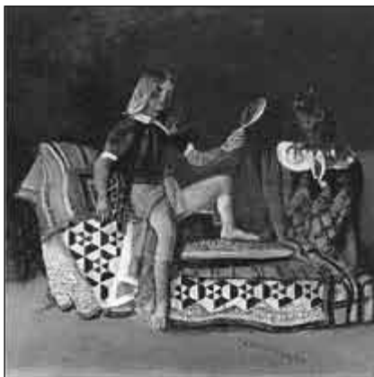
Balthus, „Kot w lustrze III”, olej na płótnie, 220 x 195 cm, 1989-1994

„Nie wiedzieliśmy, jak zobaczyć rzeczywistość i wszystkie niepokojące rzeczy z nią związane, naszych bliskich – on to dla nas odkrył” – pisał Albert Camus w 1949 w przedmowie do jednej z rzadkich wystaw Balthusa – obserwował świat bacznie, powoli, wnikliwie, sennie, zwracał uwagę na szczegóły, stąpał po świecie delikatnie, jakby na nowo odkrywając jego mroczność i świetlistość zarazem. Obrazy powstawały z wyciszenia. Niejednoznacznie, w połowie drogi między niewinnością a perwersją. Ubolewał, że dyskutuje się nad obrazem zamiast na niego patrzeć. Picasso też był zaniepokojony tym brakiem skupienia w oglądaniu obrazów, mówił: „wszyscy chcą zrozumieć malarstwo, dlaczego nie próbują zrozumieć śpiewu ptaków”.