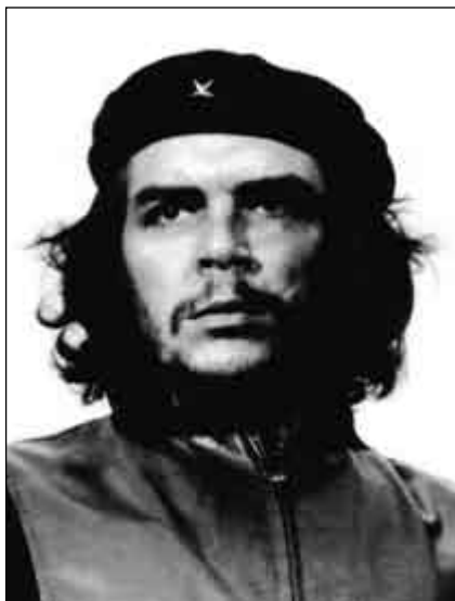
Ernesto „Che” Guevara

kucji tak długo, jak to konieczne. To śmiertelna wojna z wrogami rewolucji!” W kwietniu 1967 – roku swojej śmierci pisał w jednej z hawańskich gazet: „...Czynnikiem walki jest nienawiść, która przekracza naturalne ograniczenia istoty ludzkiej i czyni z niej gwałtowną, selektywną i zimną maszynę do zabijania...”. Wielbił Stalina, raport Chruszczowa o zbrodniach stalinowskich uważał za „burżuazyjną prowokację”. Niedługo potem chwalił Chruszczowa za masakrę powstania na Węgrzech.