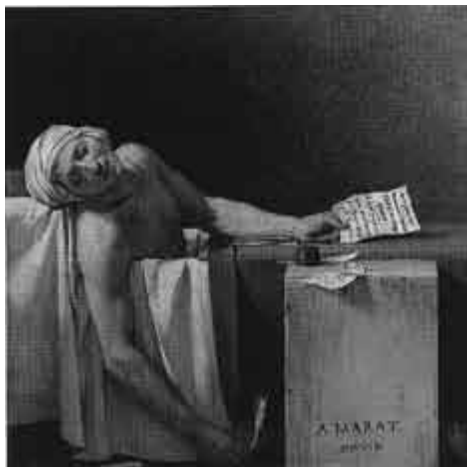
Jacques Louis David, „Śmierć Marata”, 1793, olej na płótnie, 162 x 125 cm, Bruksela

Odsuńmy (z zalem) obraz i skupmy się na człowieku, którego David namalował z czcią i uwielbieniem, z którego nazwiska uczyniono w Rosji Radzieckiej półtora wieku później imię, nazwano nim ulice, statki wojenne, stawiano pomniki.