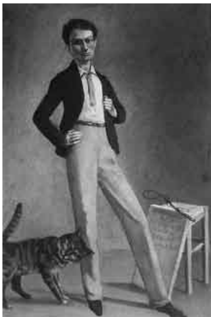
Balthus, „Król kotów”, olej na płótnie, 71 x 48 cm, 1935

Zharmonizowanie wszystkich odcieni ugru widoczne jest na obrazie zatytułowanym „Akt z kotem”, namalowanym w latach 1948-1950. Na komodzie widać wylegującego się kota, leniwie rozciągniętego w swoim zadowoleniu. Trzeba dobrze znać naturę kota żeby tak celnie pokazać jego nastroje, jego niezależność – radośnie wymruczana.