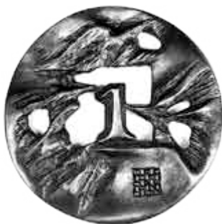
Medal nr 1 3. MFS. Autor medalu: artysta rzeźbiarz prof. Stefan Dousa